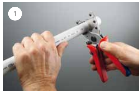
Op lengte maken