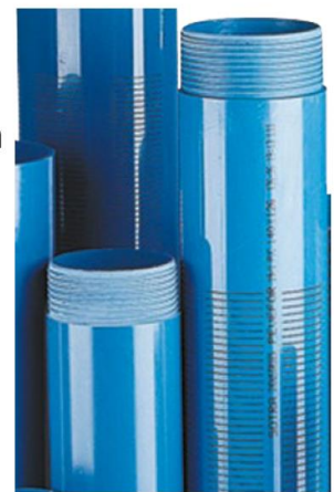
TTSF - Trapezoidal Thread with Socketed Female end (according to DIN 4925).